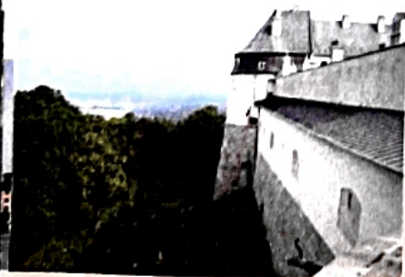
V okolí Bratislavy je viacero atraktívnych pamätihodností. Medzi ne sa radí aj hrad Červený Kameň s múzeom v Malých Karpatoch.

Nezamestnanosť v kraji je najnižšia na Slovensku. Do Bratislavy dochádza veľký počet obyvateľov z celého kraja, ale aj zo Slovenska. V Bratislave sídlia naše najvýznamnejšie správne a zákonodarné orgány: Národná rada Slovenskej republiky, vláda, prezident Slovenskej republiky.