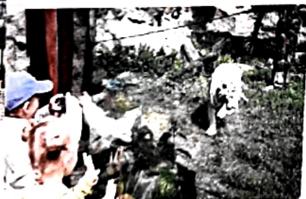
Častým cieľom detských návštevníkov Bratislavy je zoológická záhrada.