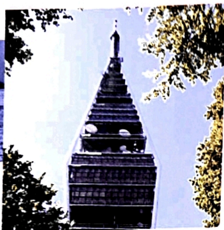
Dominantou tvoriacu sa nad Bratislavou je televízna veža na Kamzíku. Jej okolie tvorí Bratislavský lesopark, obľúbená oddychová zóna obyvateľov hlavného mesta.