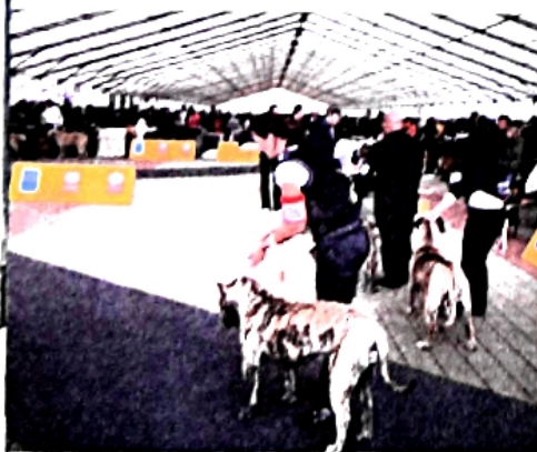
Vysokú návštevnosť majú aj výstavy, najmä medzinarodné. Takou bola aj Svetová výstava prívov v Bratislave v roku 2009