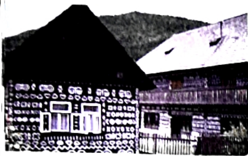
Pre návštevníkov Slovenska je stále atraktívna aj ľudová kultúra – často zachovaná priamo v pôvodných obciach (Čičmany).