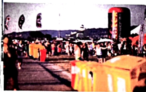
Masovú podporu najmä mladších návštevníkov si získali hudobné festivaly pod holým nebom, napr. v Trenčíne