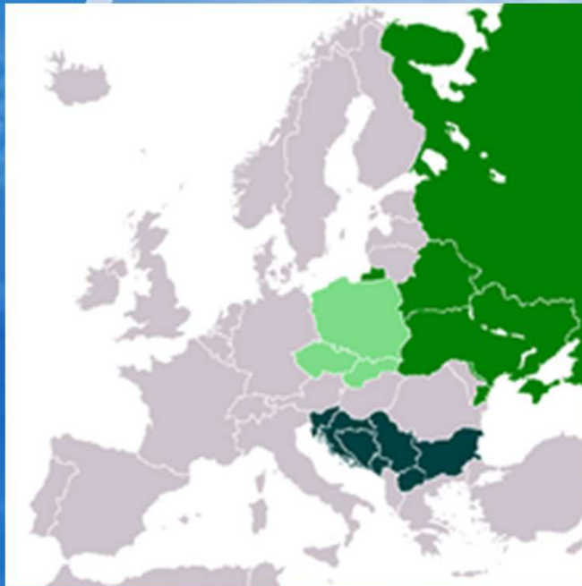
Slovanské krajiny v Európe

Názor o jednom slovanskom národe a všeslovanská vzájomnosť mali posilniť sebavedomie malých slovanských národov a pomôcť im v národnom zápase.