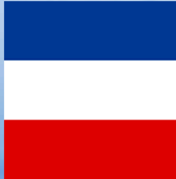
Všeslovanská vlajka schválená na všeslovanskej konvencii v Prahe v roku 1848