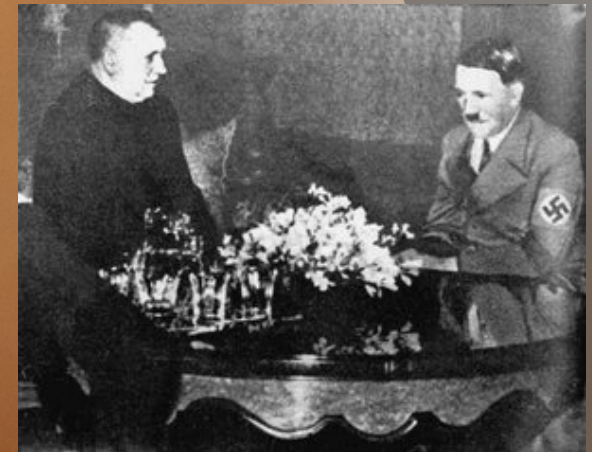
Stretnutie Hitlera s Tisom (prezidentom Slovenského štátu.)